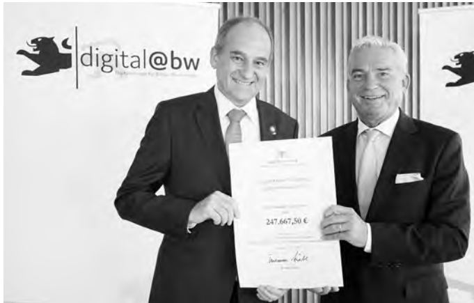
Von links: BM Uwe Morgenstern, Thomas Strobl, stellv. Ministerpräsident und Minister für Inneres, Digitalisierung und Migration

programm der baden-württembergischen Landesregierung geht es darum, den Breitbandausbau vor allem in der Fläche voranzubringen und auch gerade ländlich geprägte Gegenden nachhaltig attraktiv zu gestalten – als Wohnort, Wirtschaftsstandort und Tourismus-Ziel.